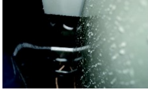
Fotografie prostoru mezi jímkou a silnostěnnou fólií k vylití betonem.